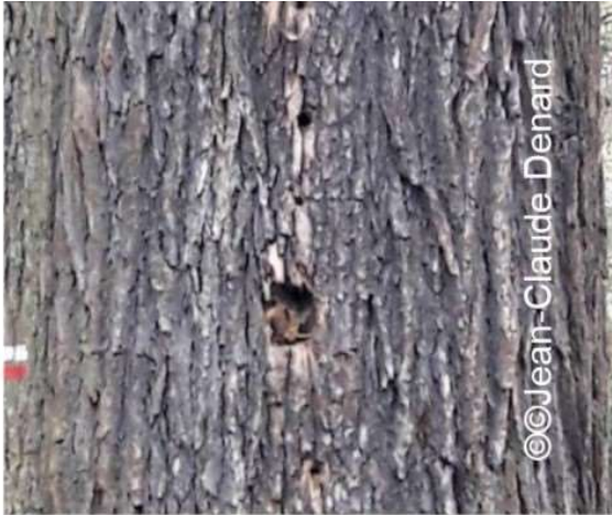
Trou de pic