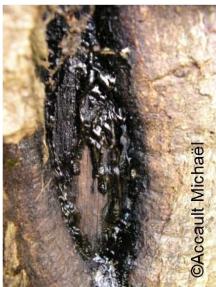
Coulée de sève