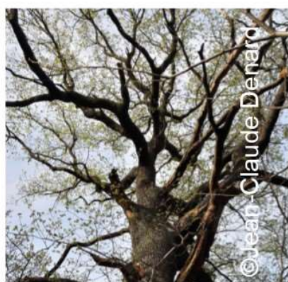
Bois mort dans houppier