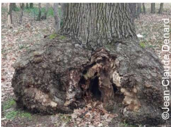
Cavité à terreau de pied