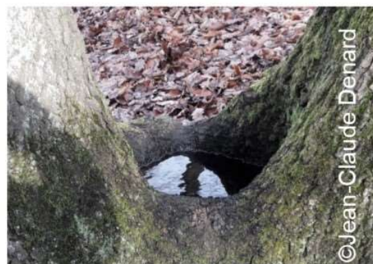
Cavité remplie d'eau ou dendrotelme