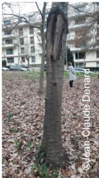
Bois non carié de tronc