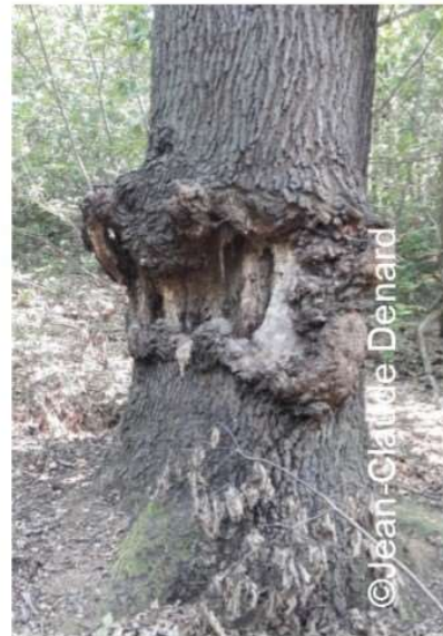
Bois carié de tronc